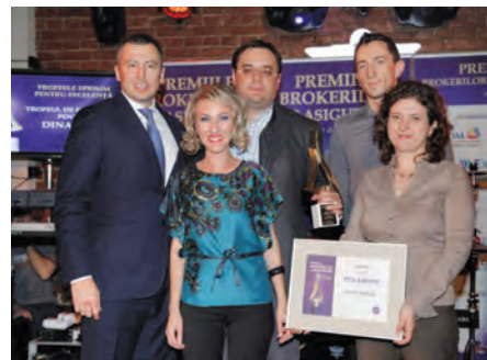
Gala premiilor Xprimm 2013